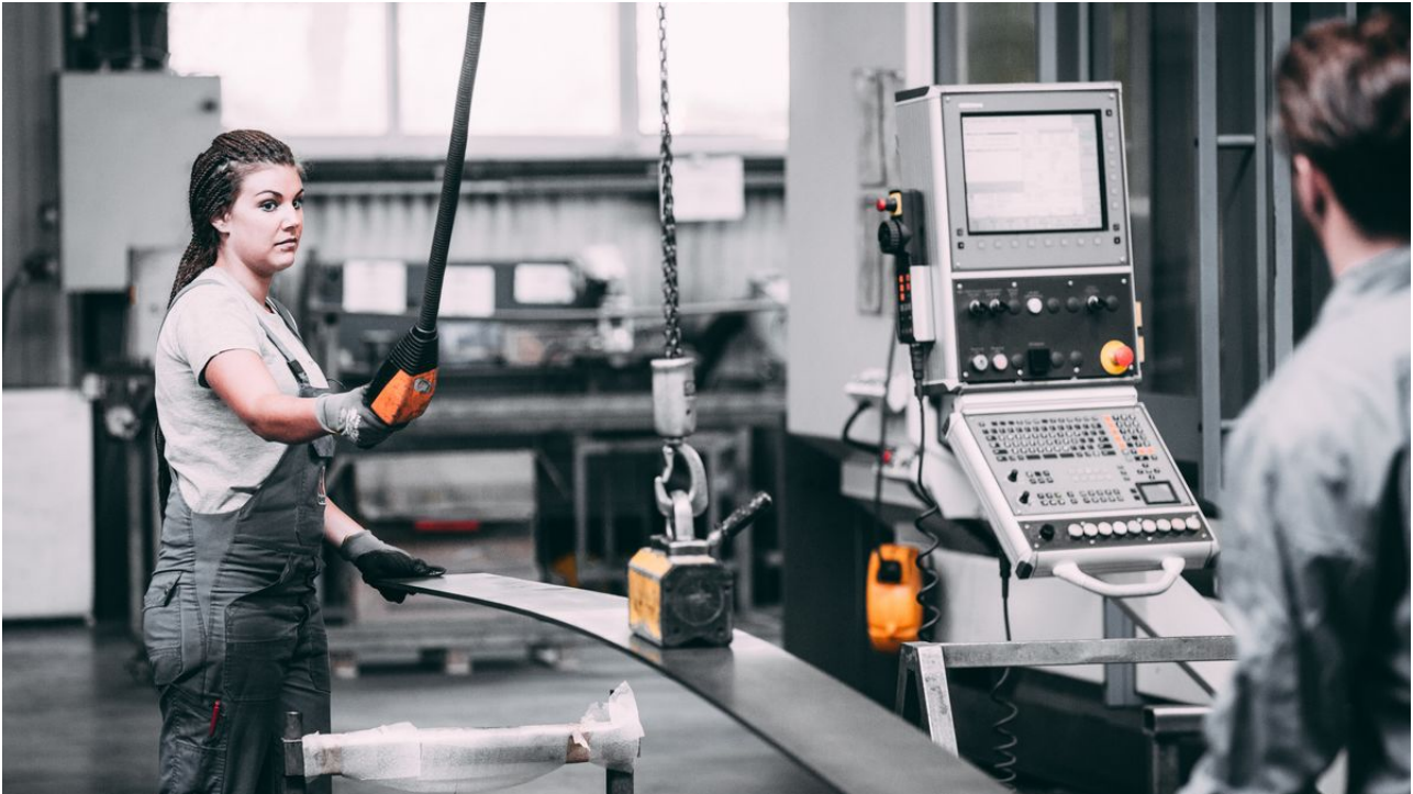
Weibliche Lehrlinge werden im ABV mein Job sehr geschätzt und gefördert.